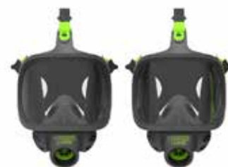
Respiratori a Pieno Facciale BLS 3400 - BLS 3150 (V)