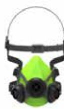
Respiratore Semifacciale BLS SGE46