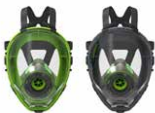
Respiratori a Pieno Facciale BLS 5400 - BLS 5150