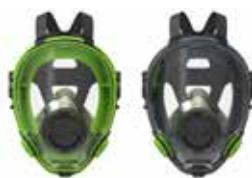
Maschere a Pieno Facciale BLS 5700 - BLS 5600