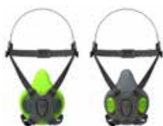
Maschere Semifacciali BLS 4000 S - BLS 4000R